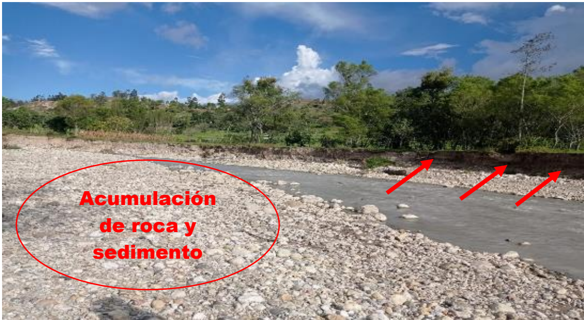
FOTOGRAFIA N°01: SOCAVACIÓN EN LA MARGEN DERECHA Y ACUMULACION DE