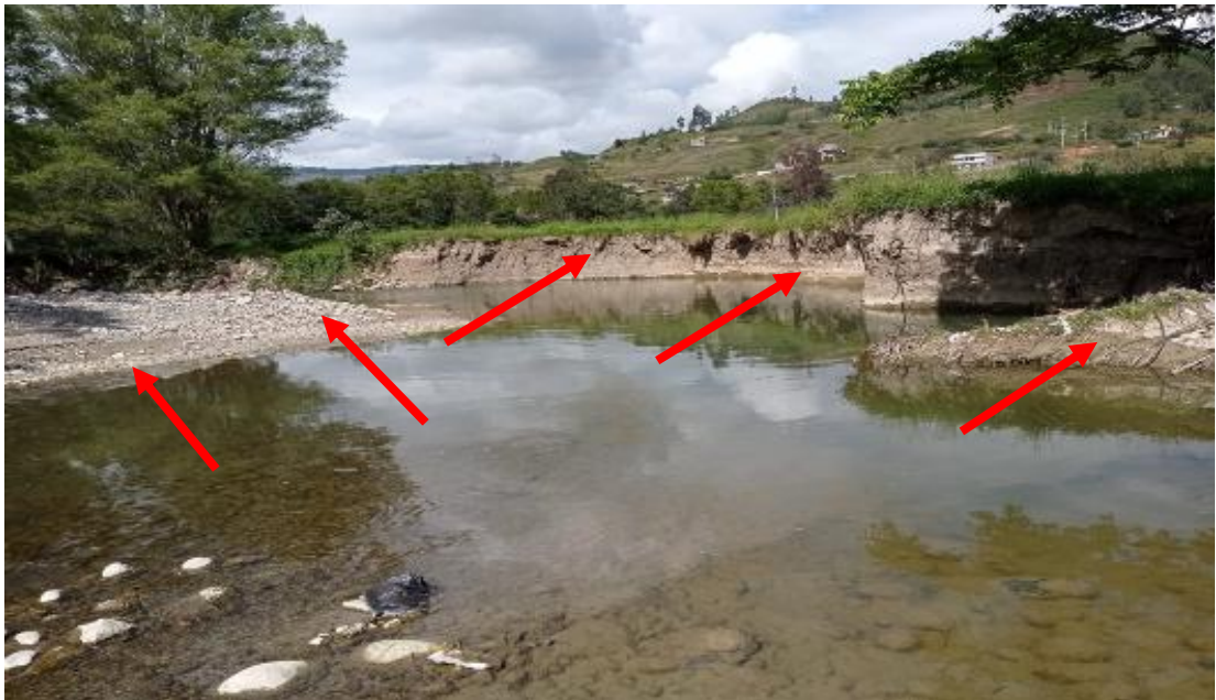
FOTOGRAFIA N°02: SOCAVACIÓN EN AMBAS MARGENES DEL RIO CHOTANO EN LA TEMPORADA DE MAXIMAS AVENIDAS.